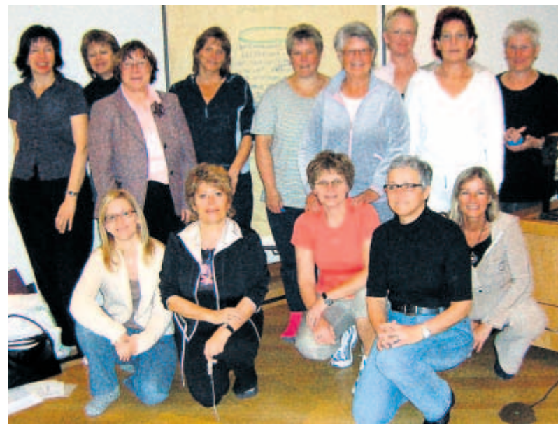
Sie suchten und fanden Harmonie und Ausgleich: Ein interessantes Seminarwochenende erlebten die Unternehmerfrauen im Handwerk aus den Arbeitskreisen Siegen und Olpe.